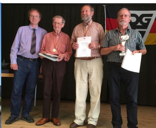
Siegerehrung beim A-Finale

Endstand im A-Finale bei der Einzelmeisterschaft (10 Spieler) am 26. Mai 2018